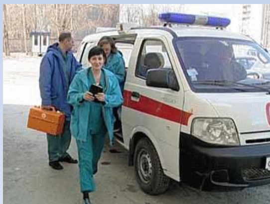
Оказание помощи на дому

Остро требуется проведение операций по эндопротезированию суставов больным гемофилией на Урале, без необходимости поездки в Москву