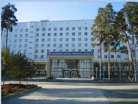
Областная клиническая больница №1