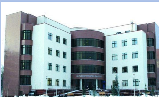
Областная детская клиническая больница №1